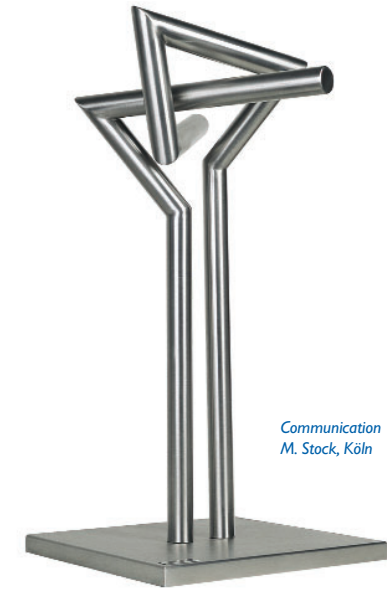
Communication M. Stock, Köln