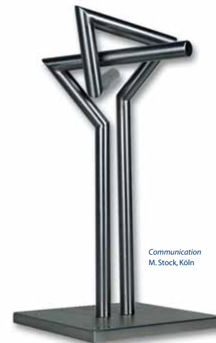
Communication M. Stock, Köln