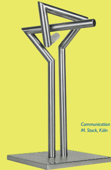
Communication M. Stock, Köln